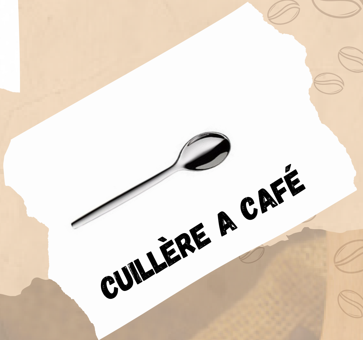
CUILLÈRE A CAFÉ