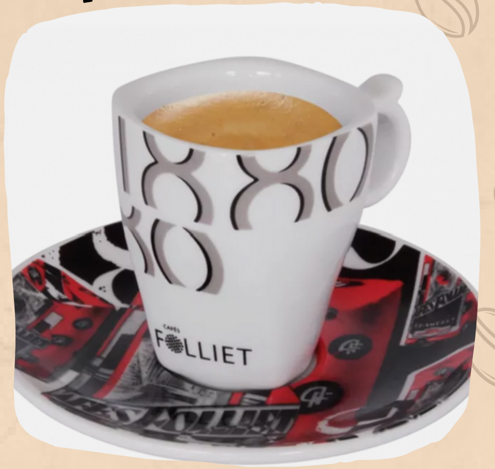
TASSE A CAFE