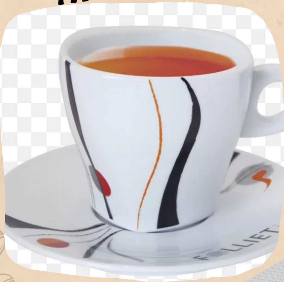
TASSE A THE